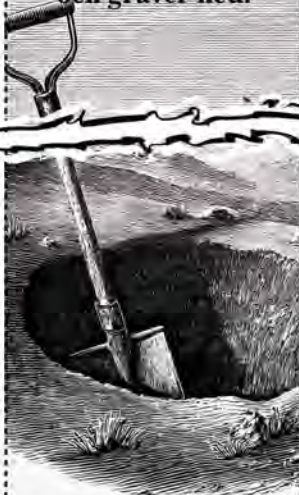
Gräver upp och gräver ned.