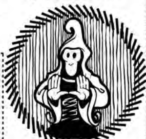
Transformation, insikter & utveckling