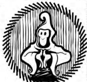
Fysisk eller psykisk skada

Ordlöst radar de upp sig och kombinationen av deras tecken avgör det öde som väntar den spådde. Nåde den för vars ansikte handsignalerna vittnar om död och elände! Viskningar och Rop har grävt i de gamla urkunderna och kommer här med en snabbguide i vad spådommarnas tecken betyder.