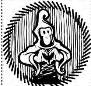
Kärlek och vänskap